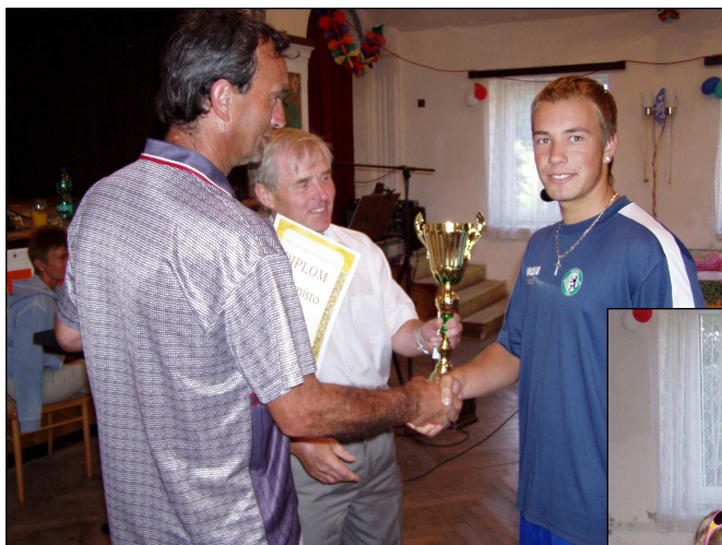
↑ 1. místo fotbalový turnaj (Baník Most) ↓ 3. místo fotbalový turnaj (Baník Brandov)

Jménem obce Nová Ves v Horách srdečně gratulujeme všem uvedeným vítězům!