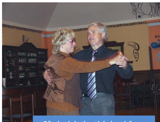
Předvolební setkání s občany