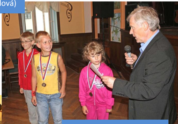
Letní sportovní slavnosti