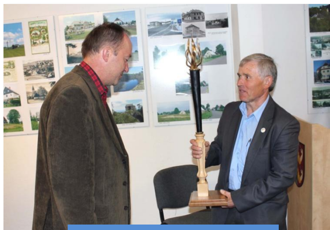
Putovní trofej Vesnice roku