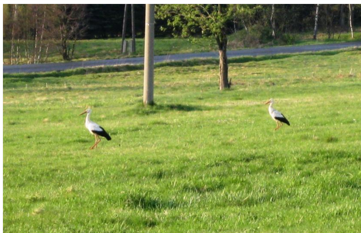
▲ „NOVÝ VĚTRNÍK NA VÝŠINĚ“ „TAKOVÍ KRASAVCI SE PROCHÁZEJÍ U NÁS ZA HUMNY“ ▲