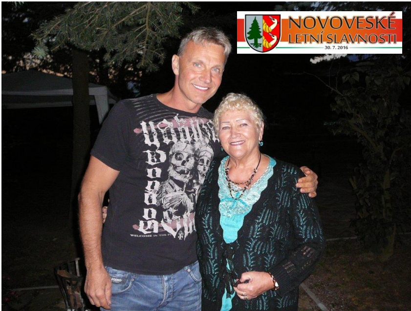
V rámci Novoveských letních slavností vystoupil i známý zpěvák Martin Maxa. Se zájemci o fotku se rád nechal zvěčnit.